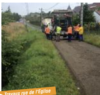
► Travaux rue de l'Eglise