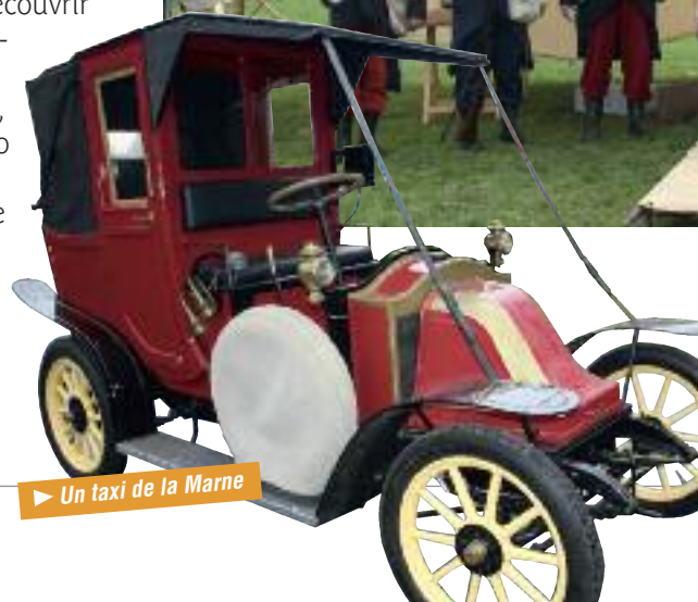
► Un taxi de la Marne