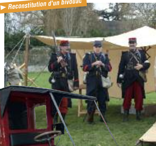
► Reconstitution d'un bivouac