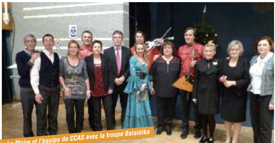
► Le Maire et l'équipe du CCAS avec la troupe Balalaïka

Un grand merci à tous les acteurs de ces événements : personnel communal, associations, élus, membres du CCAS, bénévoles à qui nous souhaitons une douce et belle année 2015 !