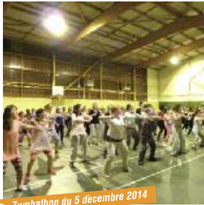
► Zumbathon du 5 décembre 2014

Quant à notre traditionnel marché de Noël organisé par l'Atelier Créatif, il s'installa le temps du week-end des 29 et 30 novembre dans la salle des Merisiers. L'occasion pour tous de faire quelques emplettes avant les fêtes auprès des exposants mais également de partager un moment convivial entre amis en dégustant une réconfortante poêlée alsacienne (choucroute, Spaetzles et saucisse de Strasbourg), sans oublier les fameuses Flammekueche en version salée ou sucrée.