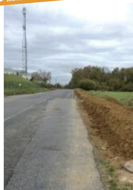
► Merlon sur la D105