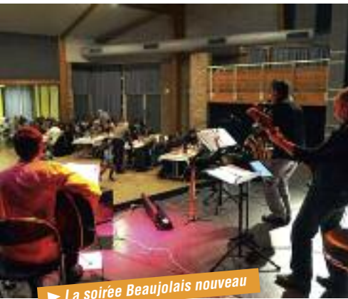
► La soirée Beaujolais nouveau

Le vendredi 21 novembre, ce fut la soirée du « Beaujolais nouveau » organisée par la Bibliothèque de la Roseraie qui réunit 150 participants. Soirée toujours sympathique animée comme tous les ans par le Jazz Band de Villevaudé.