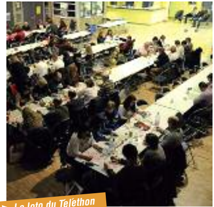
► Le loto du Téléthon

Enfin, à la mi-décembre, nos seniors profitèrent d'un repas-spectacle très attendu et apprécié de tous, placé sous le signe de la Russie, qui permit de terminer l'année dans la convivialité et dans une ambiance des plus chaleureuses.