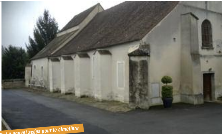
► Le nouvel accès pour le cimetière