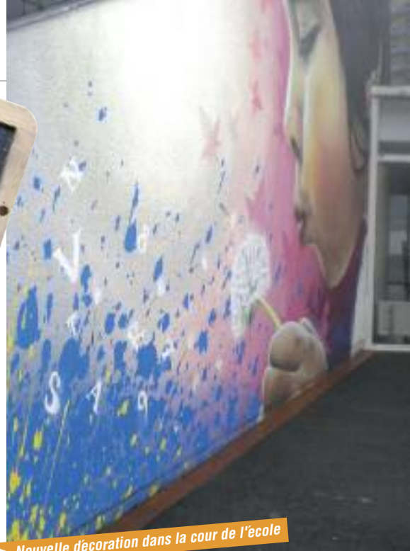
► Nouvelle décoration dans la cour de l'école

Enfin, à l'approche des fêtes de fin d'année, les élèves ont tous reçu un sujet en chocolat, l'occasion de leur souhaiter d'excellentes vacances. Noël se poursuit jusqu'au 6 janvier pour tous les enfants de l'école avec la représentation du spectacle "Dans la maison de l'ogre" (Cie du Songe d'Or).