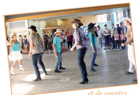
et de country