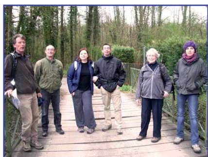
Sortie à Crépy-en-Valois