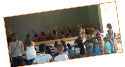
Démonstration de danse...

Cette édition fut donc un bon cru. N'hésitez pas à consulter le site Internet de la Mairie pour découvrir les autres associations. Les présidents des associations, que la Municipalité souhaite vivement remercier pour leur engagement, sont disponibles pour vous accueillir et vous inscrire à leurs activités.